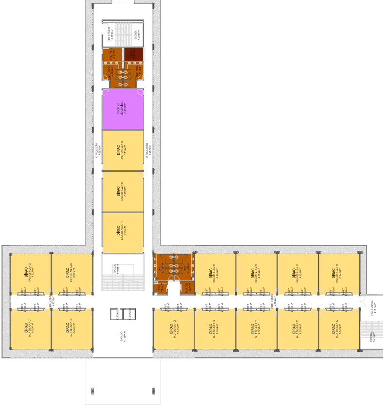
PLANTA SEGUNDO PAVIMENTO