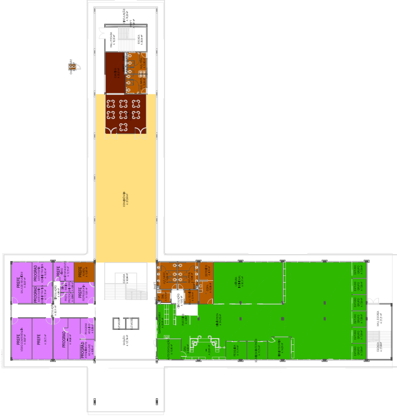
PLANTA PAVIMENTO TÉRREO